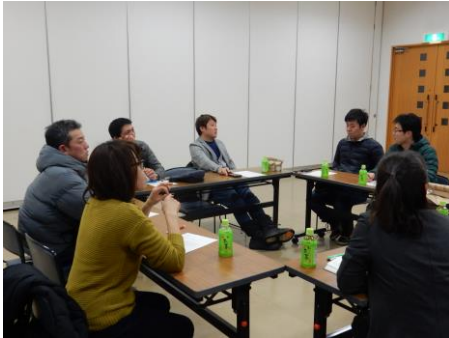
納農会を中心に「農家が共通で使えるラベル等」について検討

—— いつまでも住み続けられる活力あるまちづくりに取り組む、納内地域集落対策協議会の活動をお知らせします ——